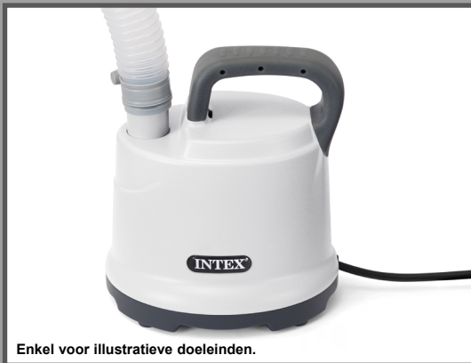
Enkel voor illustratieve doeleinden.

DRAINAGEPOMP Model DP30220 220 - 240V~, 50Hz, 99W Hmax 2.5 m, Hmin 0.01 m, IPX8